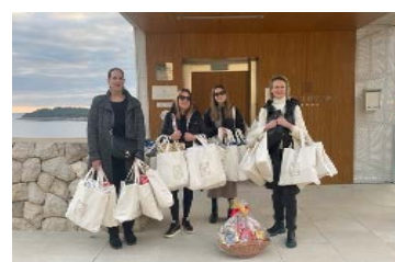
Posjet i darivanje božićnih darova djeci Doma Maslina za nezbrinutu djecu Dubrovačko-neretvanske županije 2022.