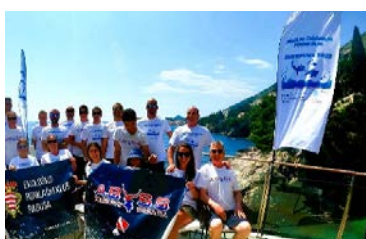
Akcija ekološkog čišćenja podmorja u akvatoriju uz pomoć ronilačkog kluba u svibnju 2023.