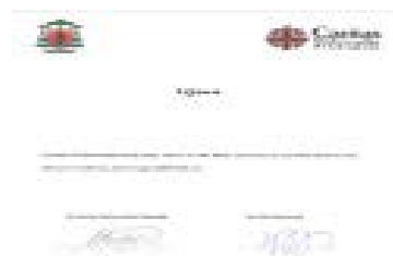
Doniranje 10 madraca Caritasu, 17. 4. 2019.