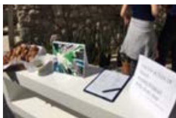
Obilježavanje Dana šuma, dijeljenje biljaka, udomljavanje 70 biljaka, 21. 3. 2019.