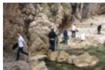
Dan čišćenja plaže Divovići, svake godine